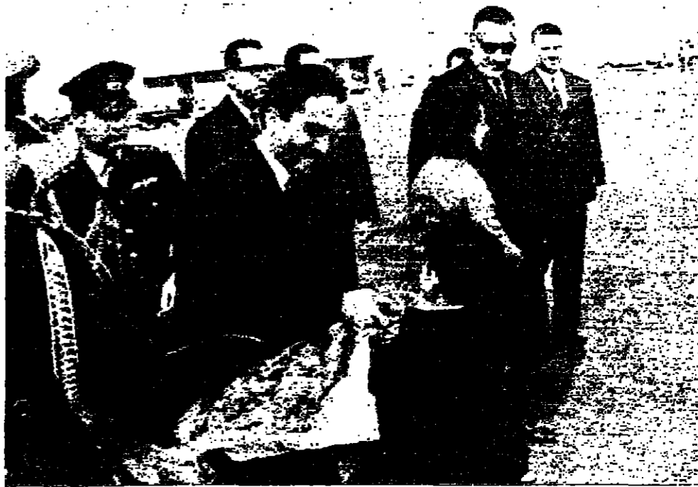
جلالة الحسين والرئيس عبد القادر بوقدين من الزهور في مطار القاهرة.